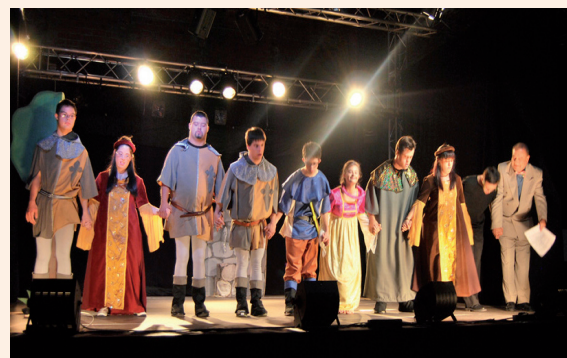
"Viene una chica" es la adaptación cinematográfica de Los males menores , del escritor y académico de la lengua Luis Mateo Díez.

DOWN LEÓN AMIDOWN quiere reconocer el esfuerzo y la profesionalidad del equipo que durante este tiempo ha trabajado en la elaboración de este sueño cinematográfico. Un equipo llegado a León de lugares tan dispares como Suecia, Madrid o París.