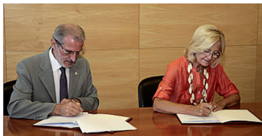
Cada una de las prácticas tendrá una duración de un mes.

ción por saber que, una vez más, la Universidad de Valencia está a nuestro lado cuando la necesitamos, pues nunca ha mirado hacia otro lado en el proceso de integración de las personas con discapacidad. Sabemos que en la Universidad de Valencia siempre vamos a encontrar el apoyo que necesitamos, y por eso estamos seguros de que éste es el primer paso de un largo camino”.