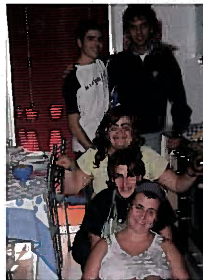
El grupo de Down Vigo.