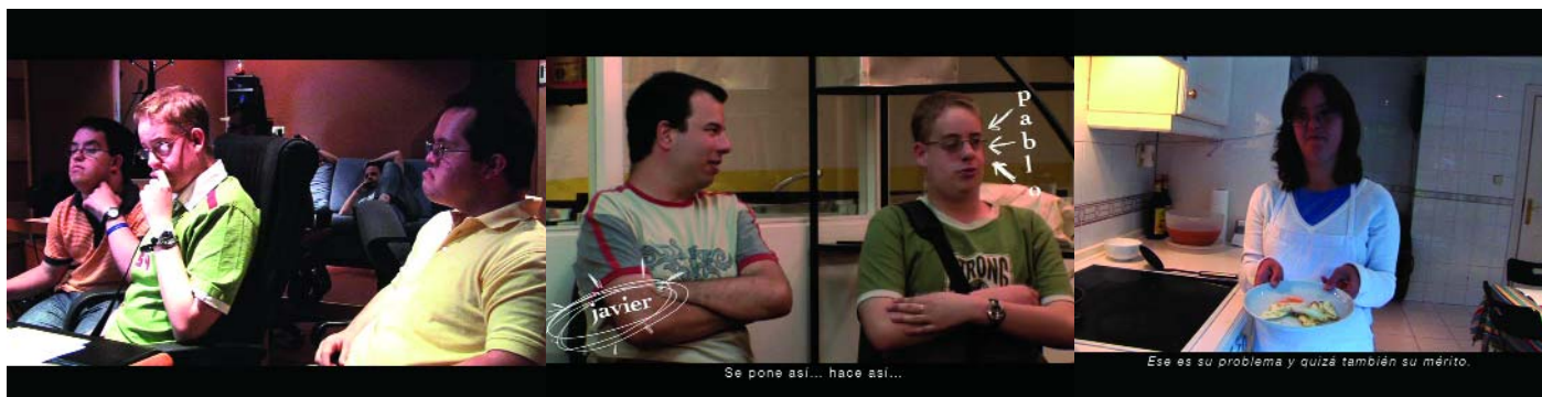
Los chicos del programa de inserción laboral de Prodis durante la realización del anuncio.

Con este anuncio, la Fundación Prodis, se propuso demostrar que, con ayuda, las personas con discapacidad intelectual son capaces de realizar casi cualquier cosa.