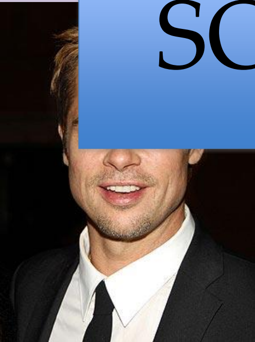
Brad Pitt (Actor)