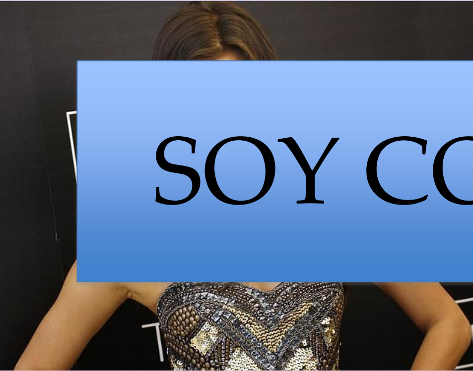
Irina Shaik (Modelo)