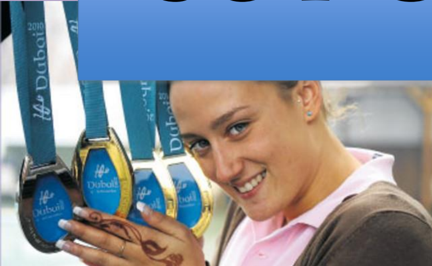
Mireia Belmonte (Nadadora)