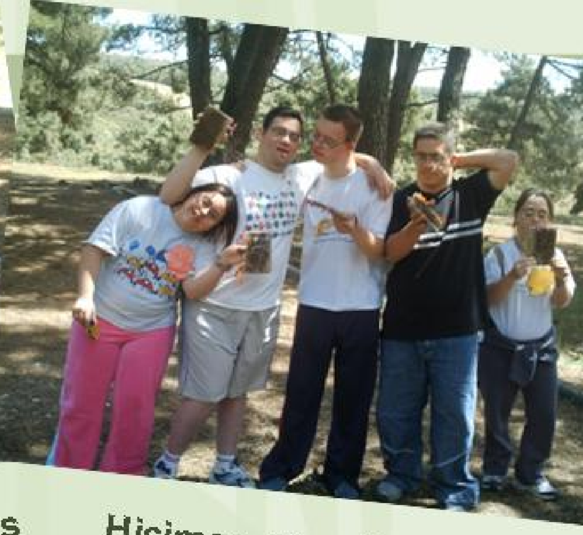
Hicimos unas libretas...