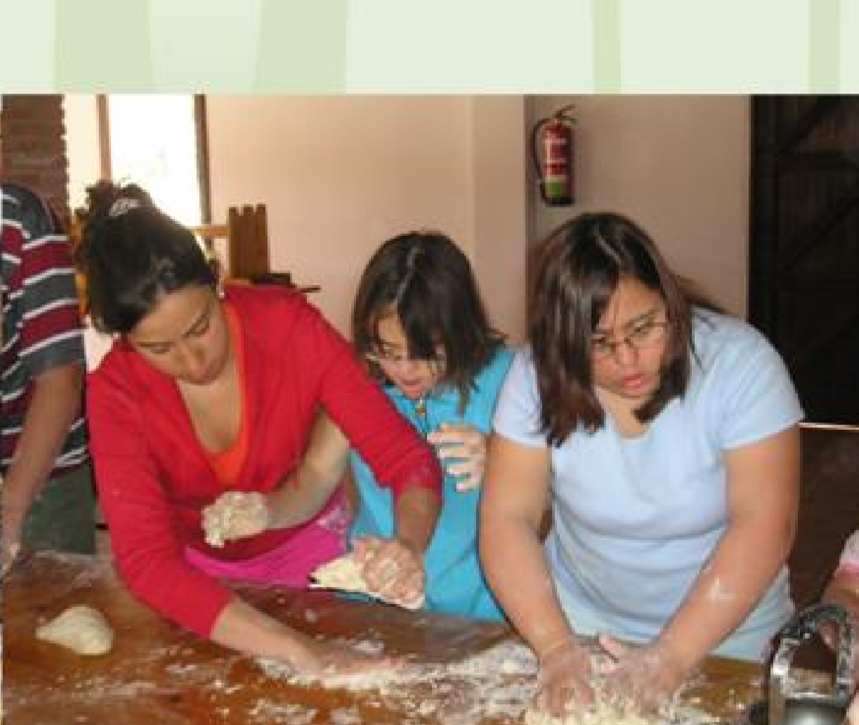
y haciendo yogur, sacos perfumados, colonia y pan