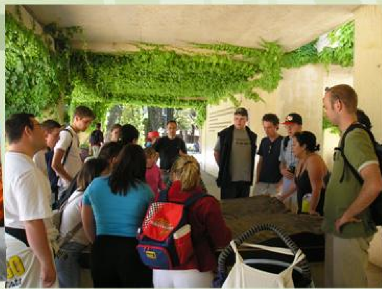
En la Alhambra de Granada