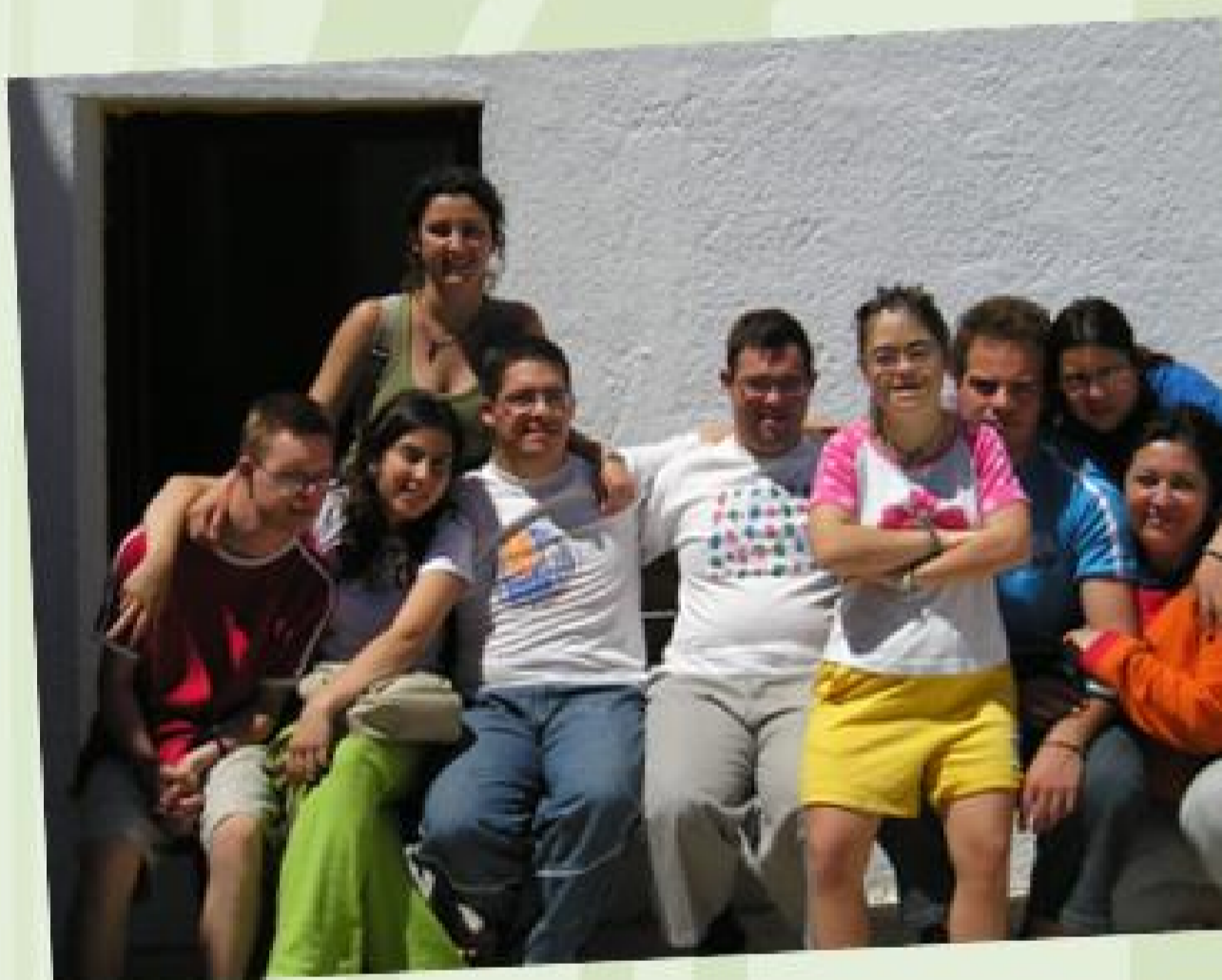
Estos somos nosotros