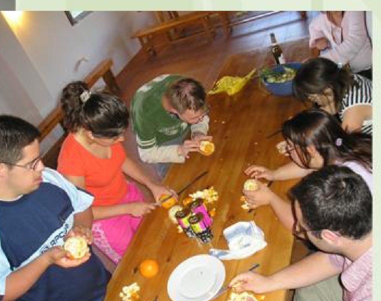
y nosotros un delicioso remojón granadino