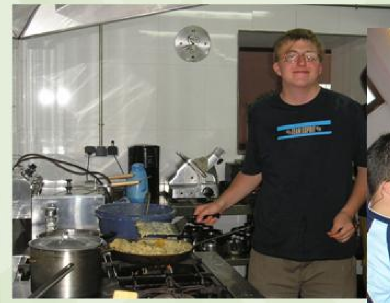
Los alemanes cocinaron un riquísimo Apfelkuchen