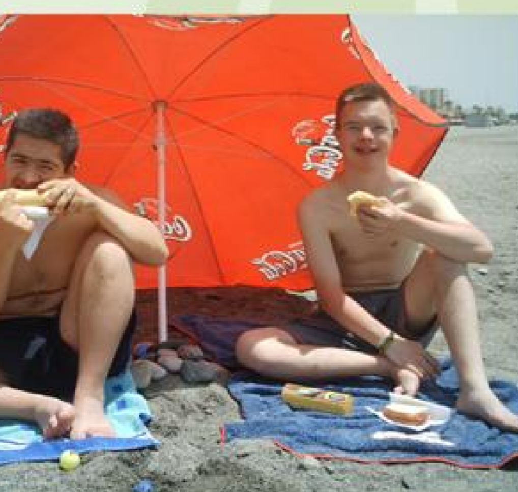
Playa de Salobreña (Granada)