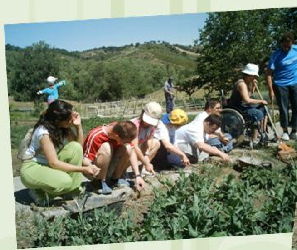
Trabajamos en el huerto...