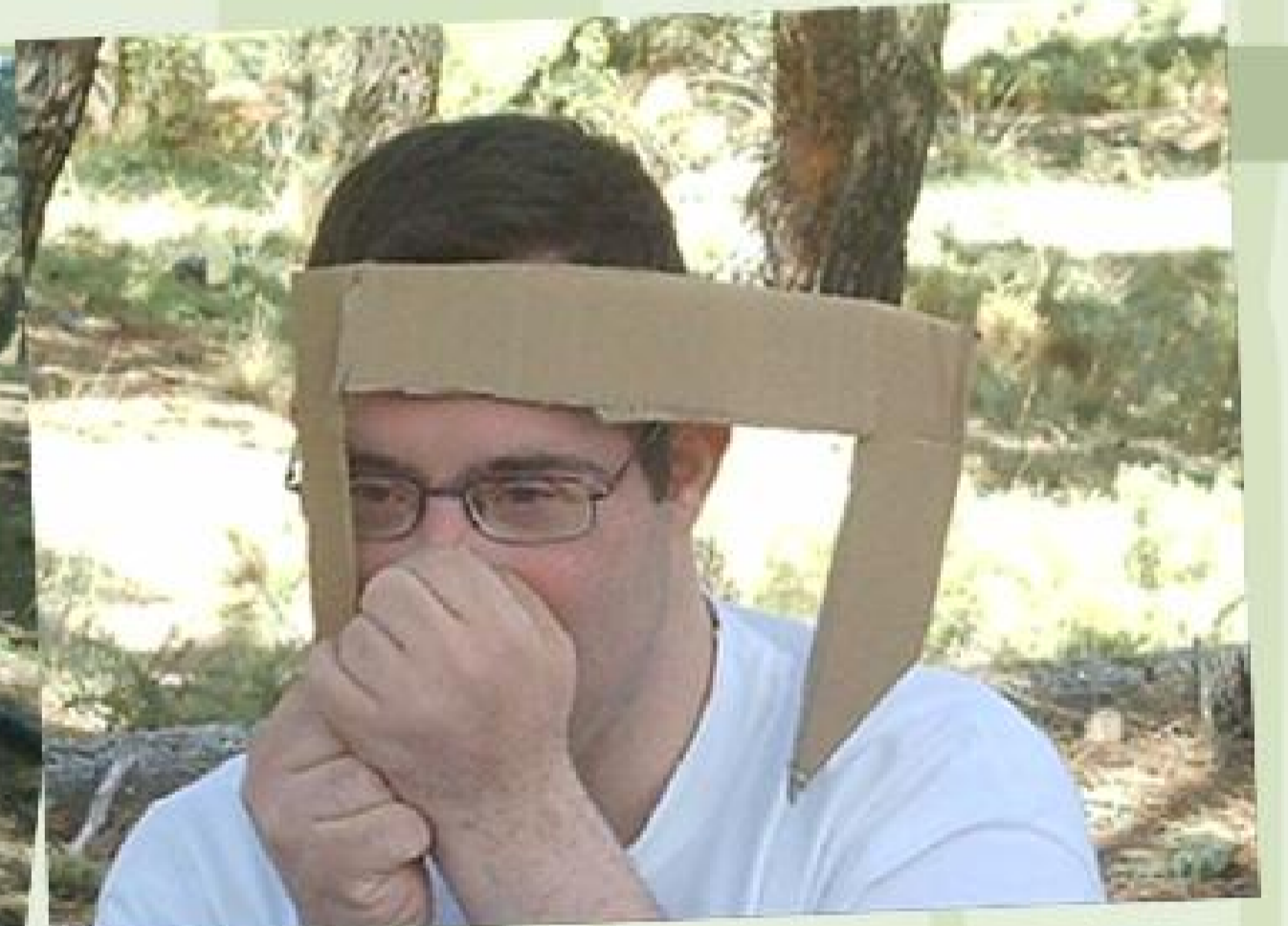
y vimos las noticias por la tele