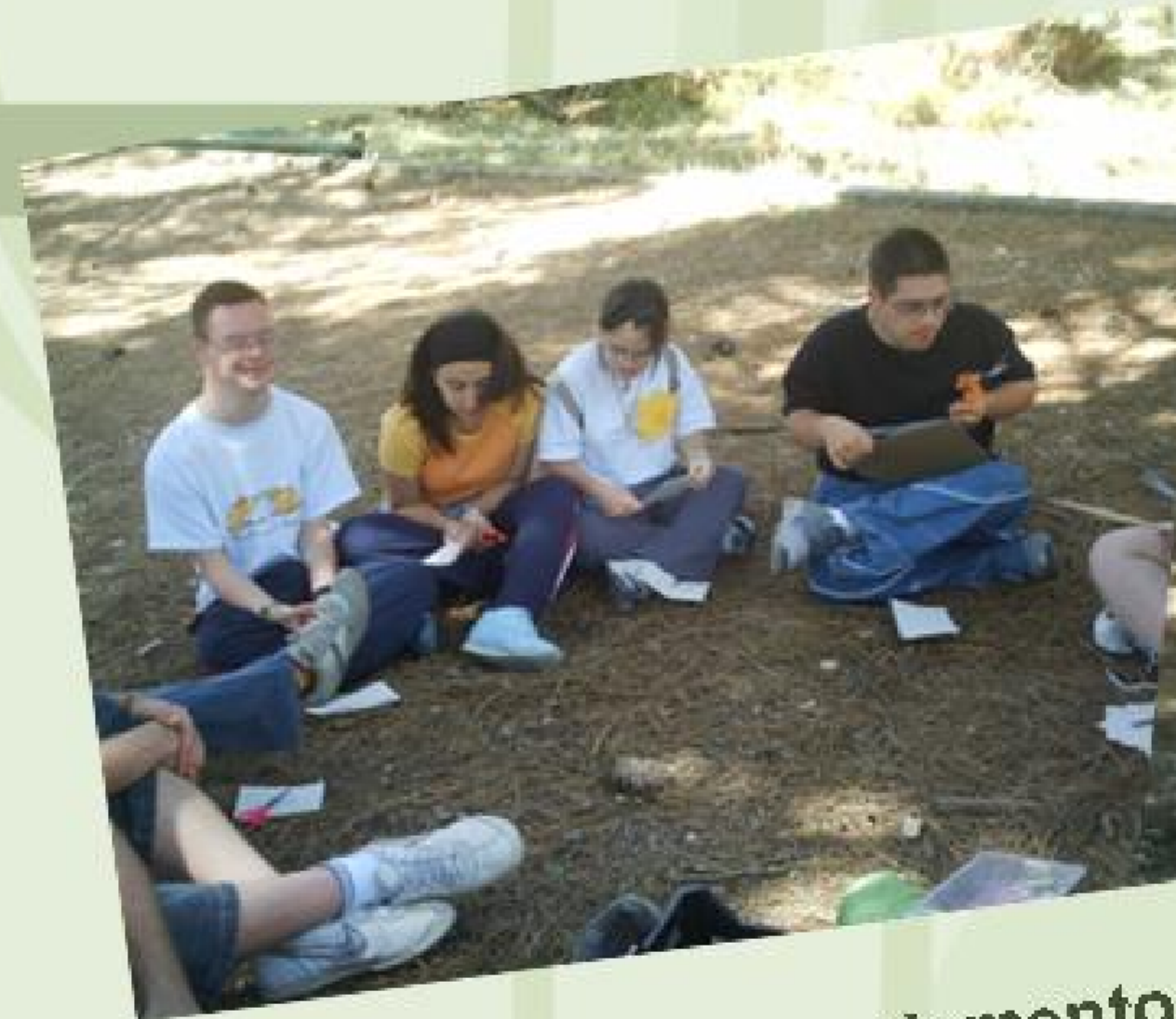
Manualidades con elementos de la Naturaleza