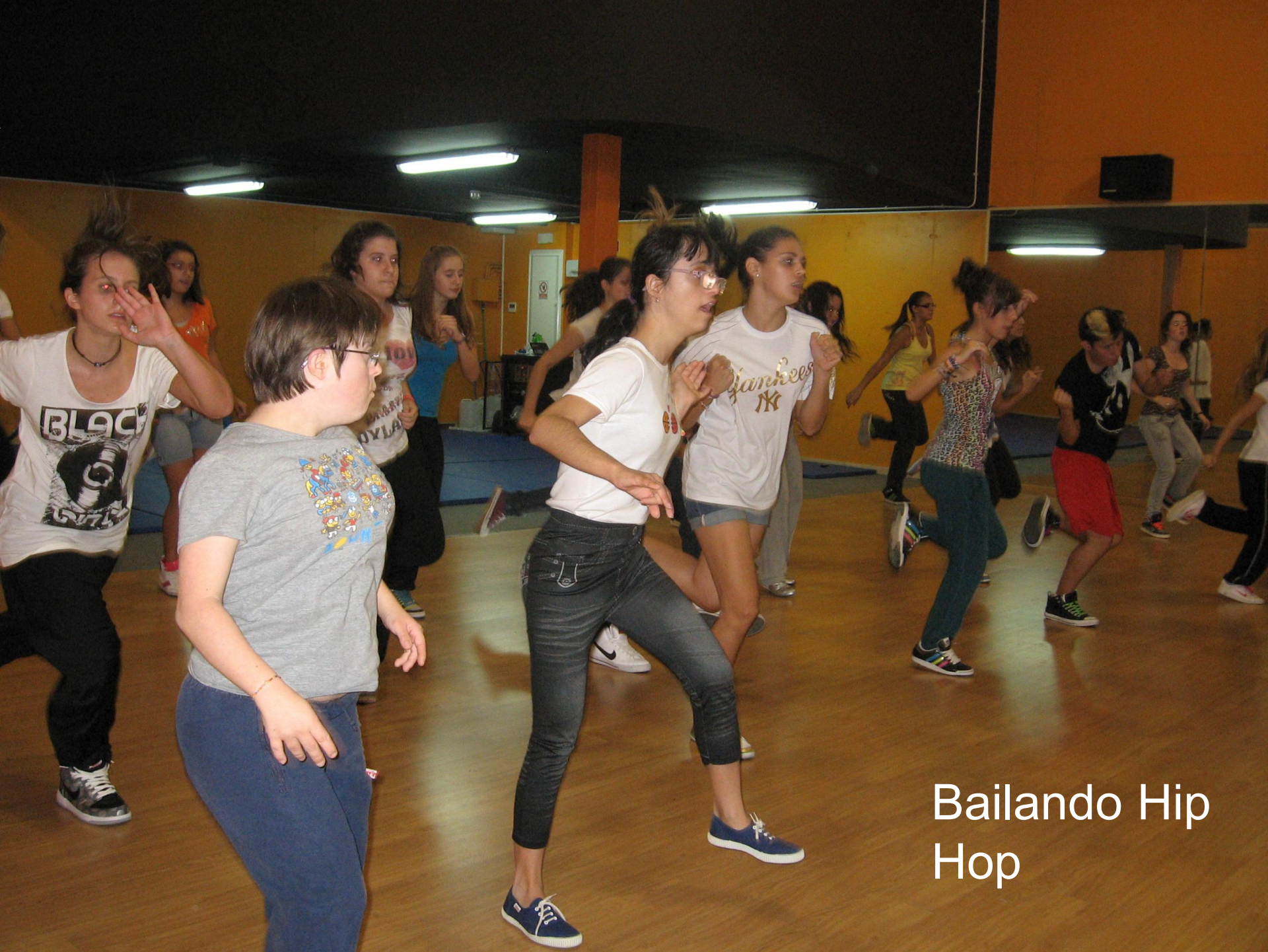
Bailando Hip Hop