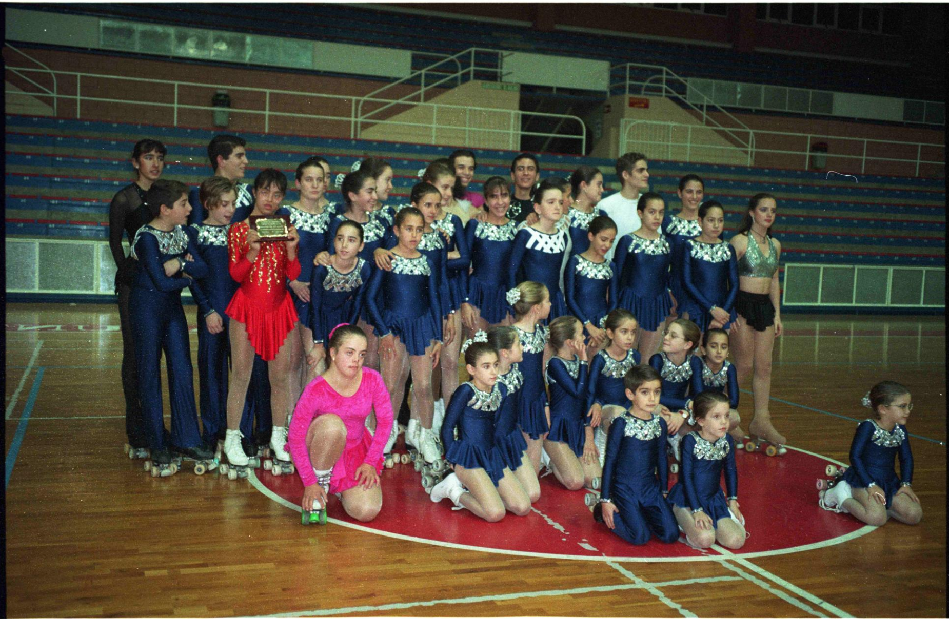
Grupo de patinaje artístico